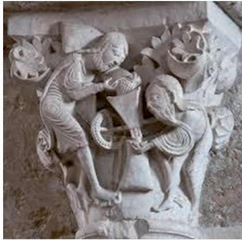
Fig. 2. Capitell de la catedral de Vézelay (França). La primera figura representa Moisès, la segona, Pau.

La retòrica clàssica —des d'Aristòtil i Isòcrates— ja va notar aquest fet dinàmic d'anticipar un futur que no sabem si serà. Viatjar en el temps és objecte de la prolepsis i l' analepsis en el discurs, i representar els conceptes complexos en imatges, objecte de la figura retòrica de l' ècfrasi . Posaré un exemple que prosseguiré després en un comentari sobre la cultura jueva. El sociòleg de la religió Jacob Taubes (1923-1963) portava sempre a sobre la imatge d'un capitell de la catedral de Vézelay (fig. 2). 7 Li recordava la complexitat de les relacions entre judaisme i cristianisme.