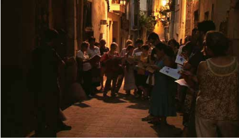
Casa on va néixer Puig i Ferrer