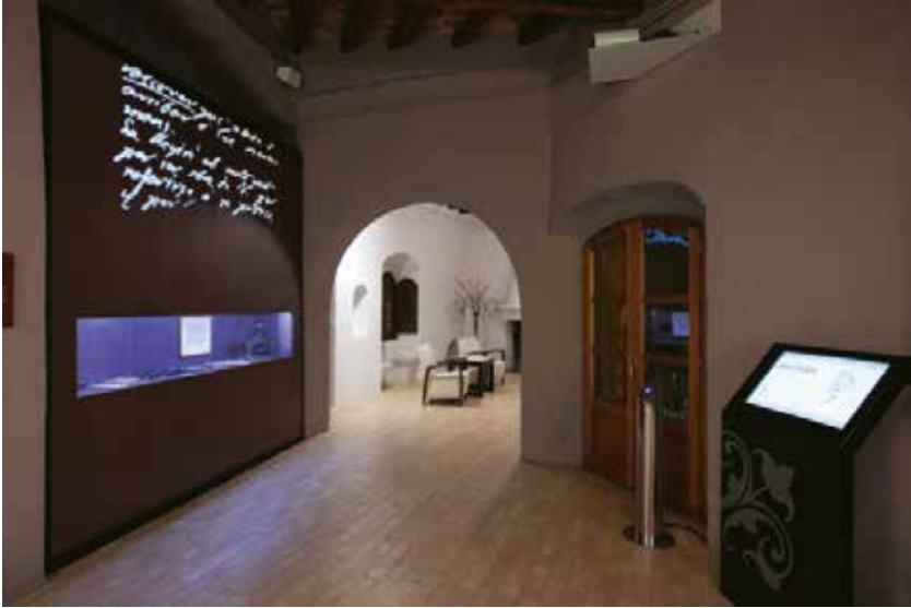
Espai expositiu dedicat al modernisme literari al Camp de Tarragona i a Cosme Vidal.

la qual van col·laborar alguns dels més destacats escriptors modernistes catalans.