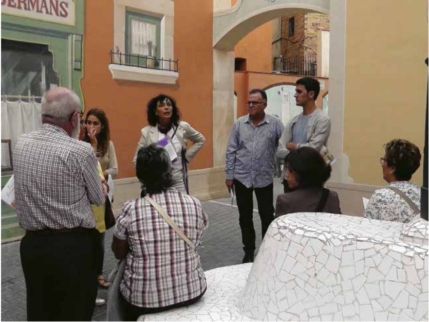
Imatge de l'itinerari literari