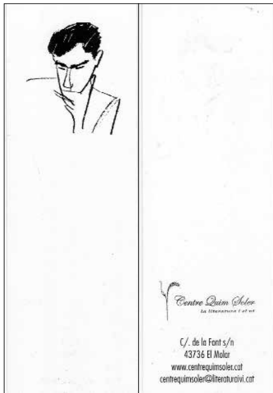
Imatge del punt de llibre del Centre Quim Soler

Priorat en Persona vol ser un espai i un temps de trobada per fer conèixer, de manera directa, a través de la seua gent, un territori que ha estat des de sempre massa invisible en l'imaginari literari català. I, també de manera directa, fer conèixer a la gent del territori els escriptors que ens visiten.