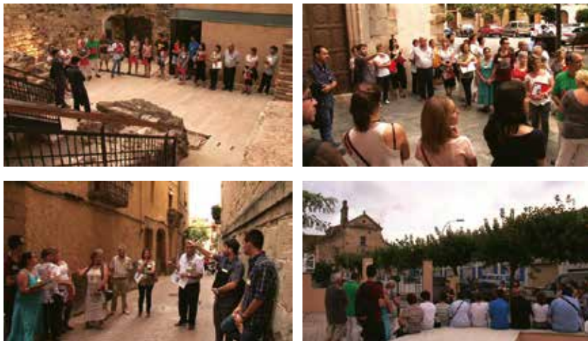
Imatges de l'itinerari literari de la Ruta Puig i Ferrer

de la societat amb la clara voluntat d'educar i acabar amb el culte a la ignorància.