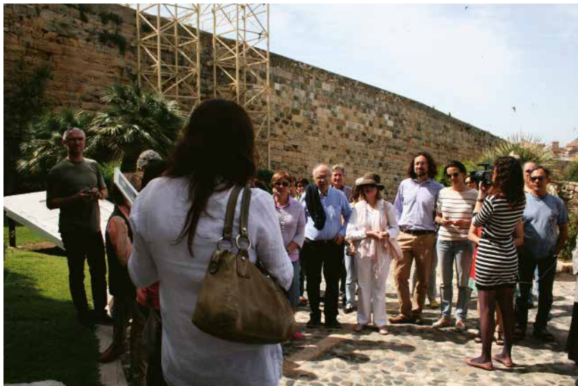
Imatge de l'itinerari literari