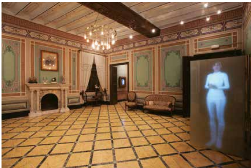
Exposició ca Batistó.