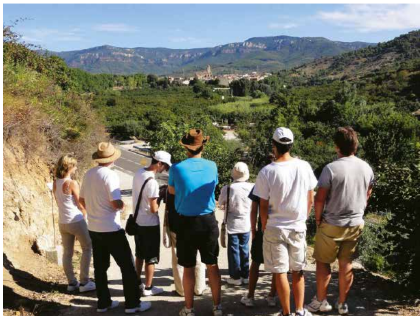
Imatge de l'itinerari literari