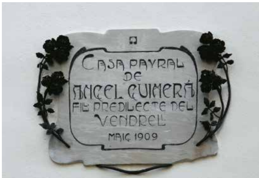
Placa de la Casa Guimerà del 1909

– Santa Cruz de Tenerife, 1916), seguiren el mateix rumb. El pare de Guimerà hi visqué des del 1829 fins al 1853. A les Canàries es dedicà al comerç a l'engròs i es casà amb Margarita Jorge Castellano, canària, amb la qual tindria dos fills: Àngel (6 de maig de 1845) i Juli (2 de març de 1849).