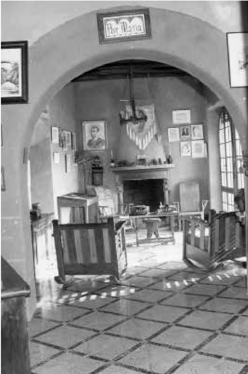
Antiga museografia de ca Batistó dedicada als escriptors il·lustres (anys 70).