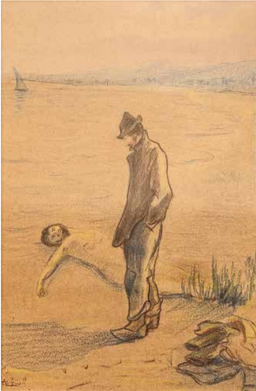
Mort a la platja, dibuix [c. 1898]