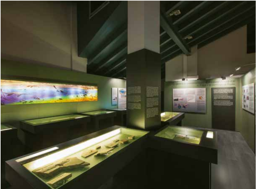
Exposició de paleontologia.

Entrat el segle XXI, però, es plantejà la restauració del vell edifici i la modernització del Museu, tant pel que fa al contenidor com al contingut. L'edifici de ca Batistó recuperava l'esplendor i l'aire senyorívol del passat, impregnat de records i d'històries que inspirarien el guió d'una nova exposició sota el títol: «ca Batistó. Modernitat burgesa i modernisme literari». El Museu ampliava, així, la seva oferta museogràfica fins aleshores centrada en una única exposició sobre paleontologia: «Les muntanyes de Prades ara fa 240 milions d'anys. Els fòssils d'Alcover-Mont-ral».