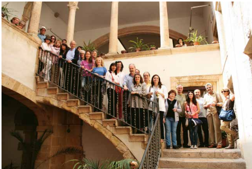
Inauguració de la Ruta Pin i Soler, 7 de juny de 2014

una claredat inusitada, de com era la ciutat prèvia a la revolució industrial, en el moment en què els nous temps tot just apuntaven. 2