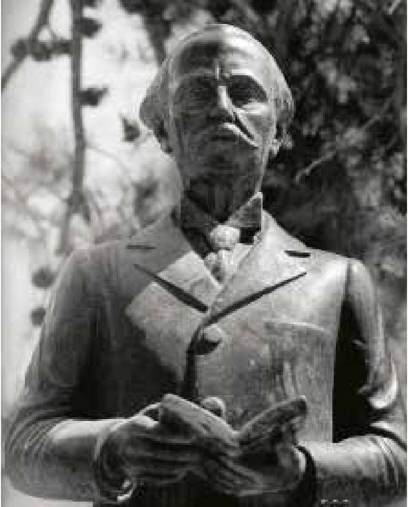
Bust de Narcís Oller

jornades bianuals que organitza a l'entorn de la figura i l'obra d'Oller, una nova ruta Oller. Així, el 2012 s'estrenà la Ruta La febre d'or . A partir de textos al·lusius de la novel·la. Els punts d'interès visitats són l'antic hospital de Sant Roc, les Monges de la Vetlla, el Teatre Principal, les Xemeneies de Ca Dasca, Casa Caritat, el parc Barrau i l'estació del tren.