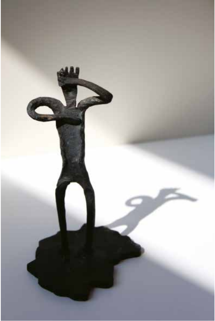
PeP: la figureta del “Priorat en Persona”