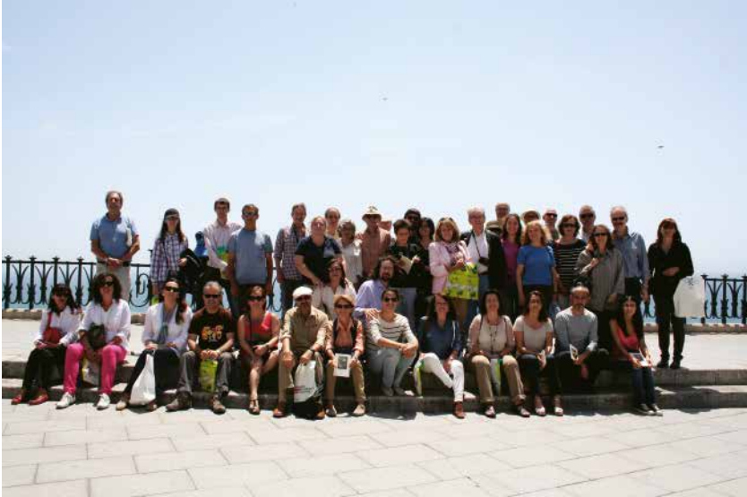
Imatge de l'itinerari literari

trasllat entre els diferents punts de la Ruta, es fan explicacions sobre els elements o espais urbans que es relacionen amb la figura, la vida i l'obra literària de Pin i Soler.