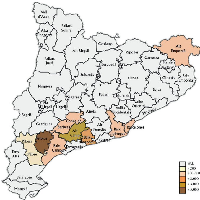
Mapa 1. Nombre d'afiliats als sindicats únics, explícitament agraris, representats al Congrés de la CNT al Teatre de la Comèdia de Madrid el 1919. 26

Si bé és cert que la majoria d'inscrits al sindicat provenien dels tallers, a la província de Tarragona va ser on més es va fer notar la sindicació pagesa. Un fet que es feu evident al congrés de la CNT celebrat el desembre de 1919 al Teatre de la Comèdia de Madrid, on participaren tres potents federacions agràries comarcals: la Federació Comarcal de l'Alt i Baix Priorat, la Federació Agrícola Comarcal de Valls i la Federació d'Obrers Camperols del Vendrell, que reunien fins a 9.242 treballadors del camp. 25