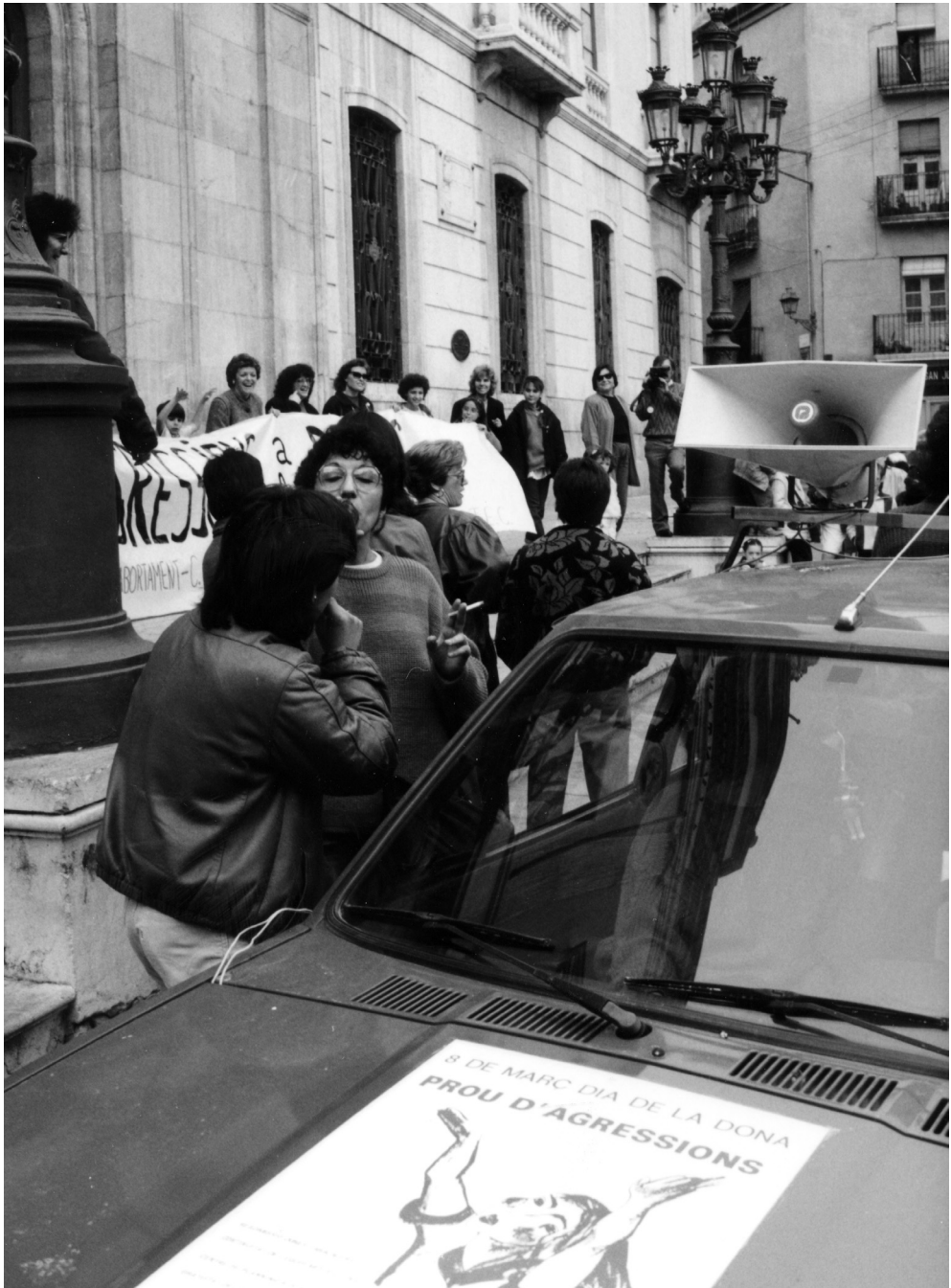
Concentració de dones davant del palau municipal tarragoní en contra de la violència de gènere (aprox. 1986). Fotografia Fons Bloc Feminista (AHT).