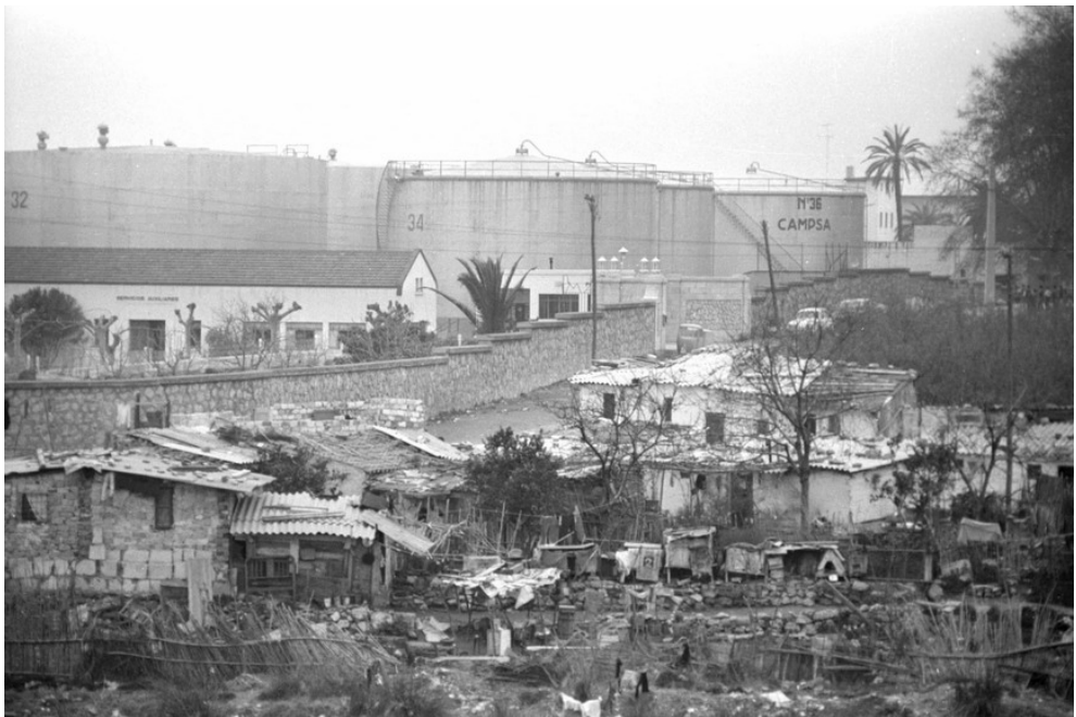
Grup de barraques al costat de la Campsa (1966).