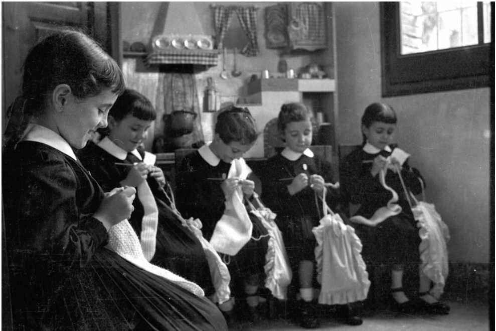
Nenes brodant a l'escola Santa Teresa de Jesús de Tarragona (1954). Fotografia Fons Canadell (AHT).