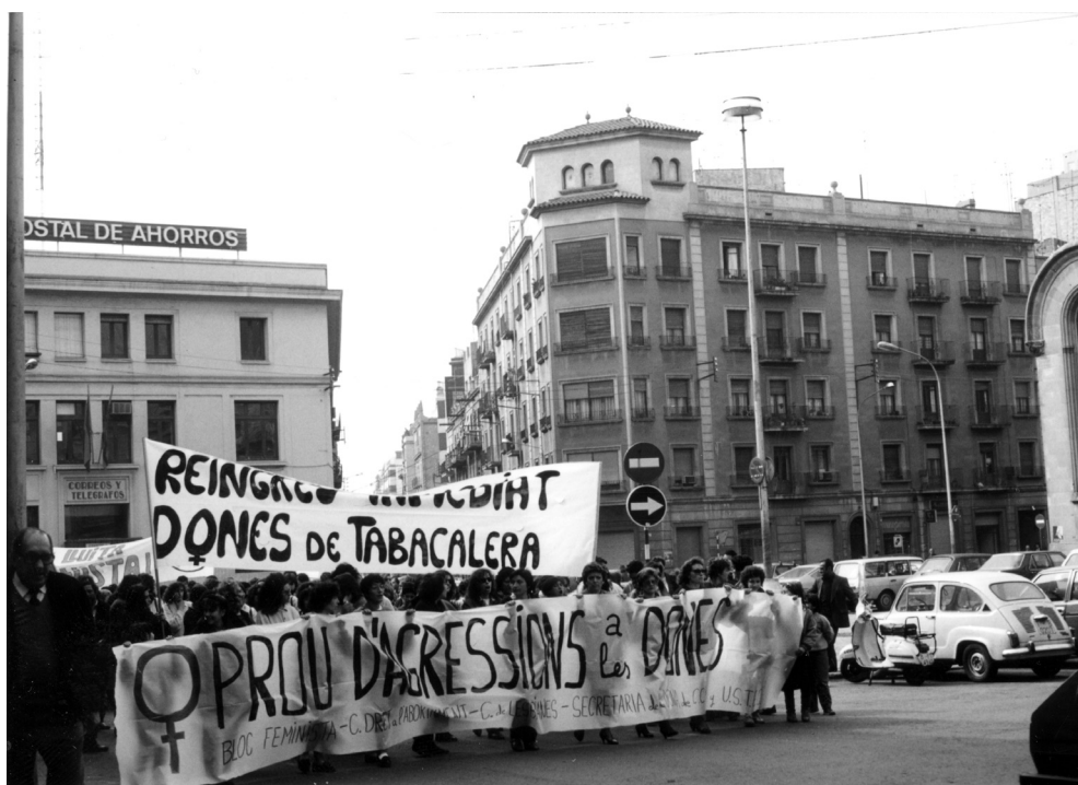
Manifestació feminista a la Plaça Corsini de la ciutat (aprox. 1986).