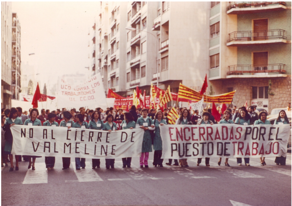
Treballadores de la Valmeline al capdavant d'un Primer de Maig al carrer Prat de la Riba, a inici dels anys vuitanta.