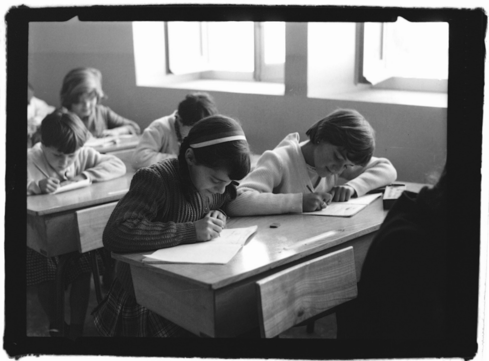
Classe de l'acadèmia Sant Pau de Tarragona (1963).