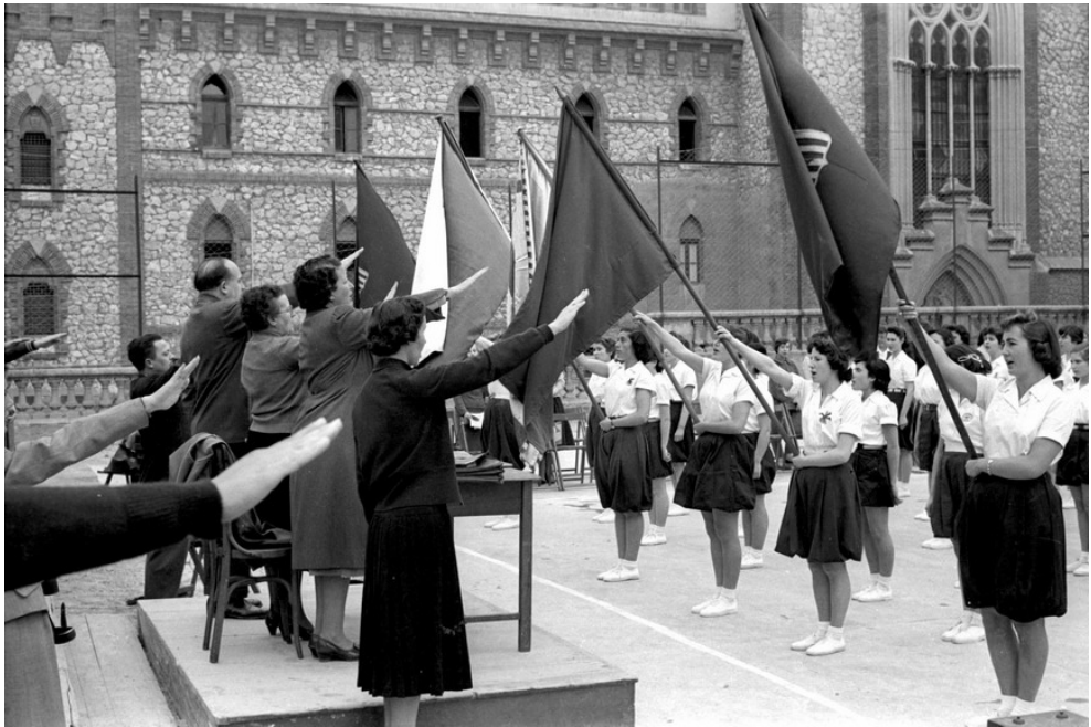
Acte de la Secció Femenina i classes de gimnàstica al pati de l'Institut Martí Franqués (1957).