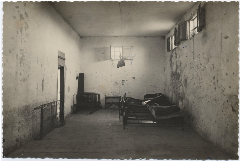
Interior de la presó de Pilats.