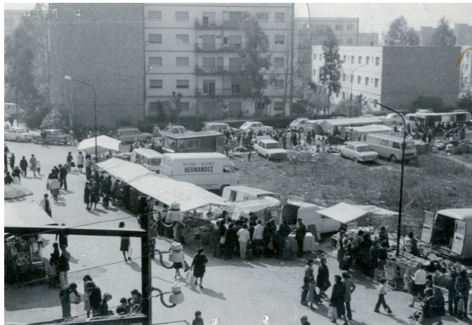
Mercat de Torreforta, anys 70.

Nos fuimos toda la familia. Íbamos por temporadas, allí se recogía el arroz, [...] algodón y aceitunas [...]. Trabajábamos muchas horas [...]. Ganábamos bastante [...], las mujeres 170 pesetas al día, los hombres ¡claro, sacarían más! Estuvimos trabajando un año nada más para pagar trampas. 21