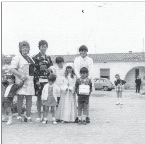
Celebracions religioses a Torreforta, al fons les Cases Baixes, anys 70.

forta o El Grupo de Jóvenes Agobiados de los Barrios i un altre com la Asociación de Contribuyentes de Torreforta. El 1982 es creà un Comitè d'Aturats.