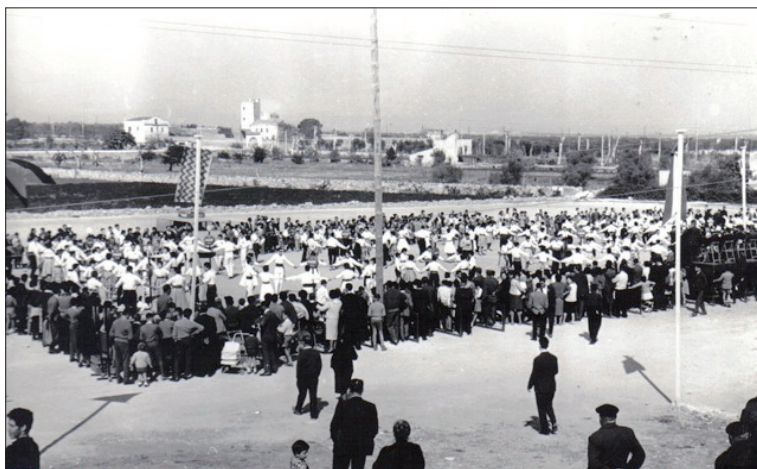
Actes populars al camp de futbol de Torreforta, anys 50/60.

Aquesta teoria, per tant, mostra la liquidat de les barreres que les anteriors perspectives intentaven presentar com a rígides, en la mesura que contempla la incidència mútua entre l'esfera d'allò productiu i d'allò reproductiu. Vull ara introduir ruptures conceptuals en paraules de Borderías, Carrasco i Alemany, 104 que s'han de tenir en compte a l'hora d'abordar l'estudi empíric. Les autores consideren el treball assalariat i el treball domèstic —i la relació d'ambdós— des d'una perspectiva que prova d'articular producció i reproducció. 105 Pensem, en primer lloc, en el treball domèstic. Des de les darreries dels anys setanta del segle xx tenim estudis que aportaren un discurs conceptual sobre la naturalesa del treball domèstic i les seves relacions amb el mode de producció capitalista com un debat polític sobre la posició de classe de les dones i el seu vincle amb el moviment socialista.