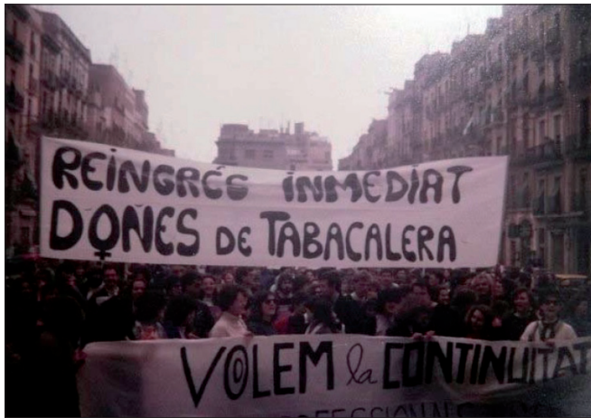
Manifestació de dones de Tabacalera, pels carrers de Tarragona, 8 de març de 1987.