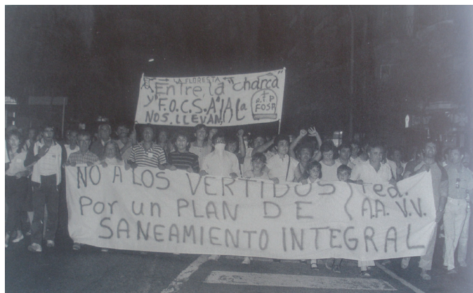
Manifestació Federació Associacions de Veïns 1985. Autor Chinchilla (AHT).

En aquests espais, dones d'arreu de Catalunya, van poder desenvolupar un ventall molt ampli d'activitats i pràctiques exclusivament femenines sota l'aixopluc de les entitats mixtes del moviment veïnal. A les vocalies, les dones trobaren un espai per a la divulgació, la formació i la lluita. Les seves demandes anaven des de la petició que els anticonceptius anessin a càrrec de la Seguretat Social, o d'assessorament jurídic en diferents aspectes, fins a la petició d'escoles per a dones adultes. Entre d'altres coses, aquests grups van jugar un paper clau en la lluita per aconseguir centres de planificació familiar. Les vocalies de dones es concebien com espais exclusivament per a dones i la presència masculina era viscuda com una intrusió. Se sentien més còmodes en espais exclusius per a elles, on podien parlar amb total llibertat i sense jerarquies.