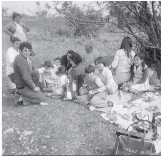
Esbarjo en família, Torreforta. Anys 70.

És important fer notar que la nostra recerca grupal té dues vessants: la pròpia investigació en si, pel que té de procés viscut i d'enriquiment personal i de grup, car contribueix a desenvolupar el saber i el coneixement que ens forma i modela; i, a més, la utilitat social que comporta, perquè el segon objectiu és, des del coneixement del passat, ajudar a millorar les condicions de vida de les persones, per tal que el veïnat de Torreforta conegui els seus orígens i la seva història, i assoleixi així el poder necessari per continuar transformant l'espai viscut, el seu entorn, la seva vida quotidiana, a partir de l'autoconeixement comunitari i de les seves necessitats i demandes col·lectives. Reescriure la història de les dones segueix sent decisiu per repensar paradigmes estàndards i marcs analítics de la història. És obvi que la historiografia del segle XXI ha d'encarar el repte de construir narratives que reconeguin la diversitat dels subjectes històrics i es proposin noves maneres de fer història. Si les historiadores de les dones del passat som capaces de canviar el coneixement, hem de confiar que allò que fem serveixi per bastir un futur millor per a les dones i els homes de les noves generacions, com deia Temma Kaplan: «a mi em sembla que el fet de pensar la història en termes de gènere ha canviat el món». 29