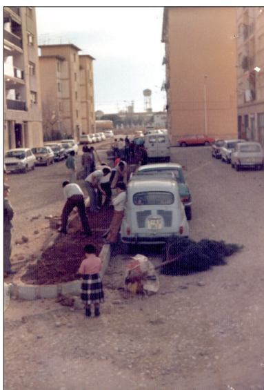
Veïns enjardinant una mitjanera, Torreforta.

perspectives innovadores i enriquidores sobre el coneixement del passat, en constant reinterpretació i reelaboració. Si bé ja cap investigador seriós i honest seria capaç, avui en dia, de negar els indiscutibles avenços de la història de les dones al nostre país, des dels anys vuitanta fins a l'actualitat, també és cert que aquests treballs encara no es visibilitzen correctament en la historiografia actual. Crec, a més, que comença a ser l'hora de fer un pas endavant i que des de les nostres anàlisis històriques contribuïm amb eficàcia a l'elaboració de la Teoria Feminista, la qual es troba també en constant renovació, mostra inequívoca de la seva vitalitat. 19 És per aquesta raó per la qual trobo indispensable plantejar en els nostres treballs el marc teòric del qual partim, com hem fet en la introducció d'aquest llibre, en la voluntat no només de fer història sinó també de construir teoria.