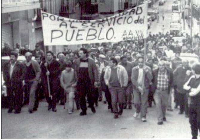
Manifestació de les Plataformes Anticapitalistes (1974).

poc temps després van aconseguir reactivar-se; un exemple més de l'ímpetu de les persones que constituïen aquesta organització, dones, en la seva majoria. Aquesta reorganització tingué la seva màxima activitat al llarg del 1975; a l'abril d'aquest mateix any van convocar eleccions sindicals, que van ser durament criticades per les Plataformes, ja que eren vistes com un fre a la lluita. 40