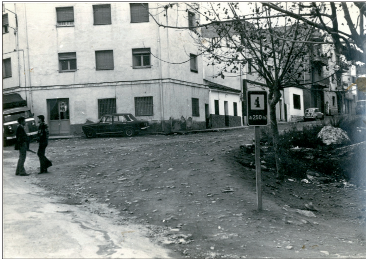
Carrer sense asfaltar, Torreforta. Anys 70.