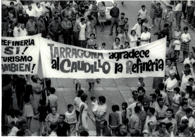
Manifestació popular a la plaça de la Font per agrair la instal·lació de la refineria a Tarragona. Els Gegants ballen a la plaça durant la manifestació.