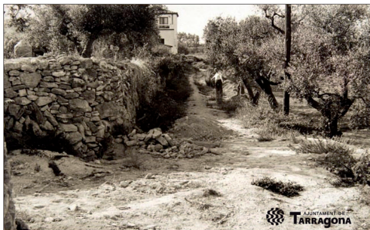
Torreforta. Vista d'un camí al costat del carrer Francolí. Autor: Vallvé.

Un altre dels fons consultats va ser el d'«Immigració», del qual vam extreure la informació d'onze dones d'edats compreses entre els 15 i els 73 anys. Aquestes dones són de Tarragona ciutat, de Sant Salvador i de Torreforta, amb oficis varis, que ens parlen del procés migratori i dels parentius. Es tracta també en aquest cas d'històries de vida prou interessants, que recullen testimonis directes del patiment durant la repressió franquista (Presó de les Oblates). Les dates extremes van de 1989 a 1990.