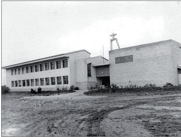
El Col·legi La Salle Torreforta, 1962.

L'any 1956 es va crear el patronat escolar San Pablo, que pretenia treballar per fer front al problema de l'escolarització al barri. Un any després es van iniciar les classes, amb aules per a nens i per a nenes que donaven cobertura a cent trenta alumnes. 29 Aquestes classes es van instal·lar en dos pisos situats al carrer Ebre i Tortosa, i finalment també es va aprofitar el vestuari del camp de futbol per encabir-hi més nens.