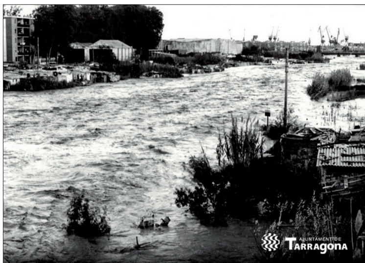
Desbordament del riu Francolí provocat per les inundacions al barranc del riu. Autor: Chinchilla.

[...] por extraño que parezca, una de las mejores playas de nuestro litoral estaba intransitable, debido a la presencia de una numerosa colonia de gitanos, que habían sido instalados allí provisionalmente, en espera de la construcción del Barrio de la Esperanza. Ocupan el edificio semiderruido de un antiguo preventorio, en un lugar de incalculables posibilidades turísticas [...], en la actualidad infinidad de basuras se acumulan por sus alrededores, y el olor es realmente insoportable, constituyendo incluso una peligrosidad grave, por el riesgo de una posible infección.» 121