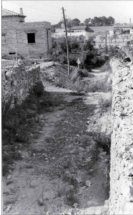
Torreforta, Carrer en construcció. Autor: Vallvé.

s'hi amaguen. Al desconeixement de la quantitat de dones presents en aquests moviments s'afegeix el de l'impacte en les relacions familiars, en las societats de sortida i en les d'acollida. I tanmateix, la presència femenina en la migració espanyola és de gran importància quan es tracta d'Amèrica, durant la segona meitat del segle XIX i principis del XX, inferior en la sortida cap a Europa i el nord d'Àfrica, i de notable volum en la migració interna, especialment en la del camp-ciutat.