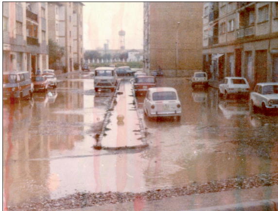
Carrers inundats, Torreforta, anys 80.