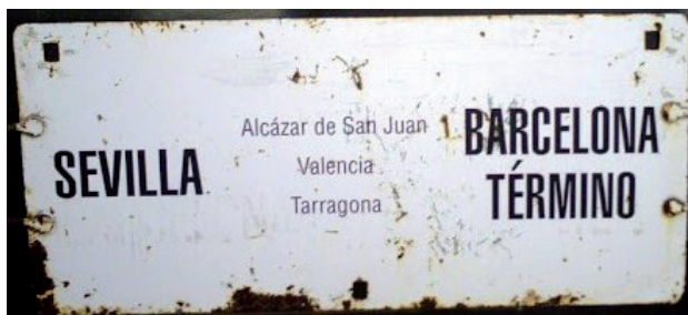
Placa del tren «El Sevillano» anys 50 i 60.

En el vagón de tren en el que íbamos los deportados había dos policías, uno en cada puerta [...] ¿por qué me llevan presa así? 61