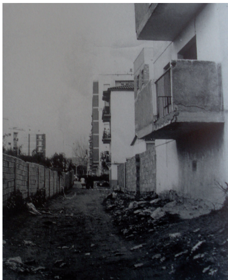
Carrer Gaià, Torreforta anys 70.

lluita feminista s'aconseguirà la igualtat formal entre dones i homes, caldrà, però, una continuació en les reivindicacions que arriba fins als nostres dies perquè aquesta esdevingui real.