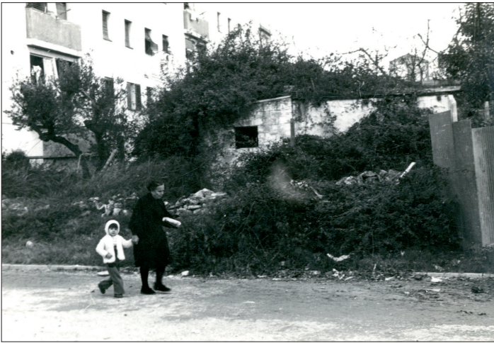
Carrers sense asfaltar, Torreforta anys 70.

Això em remet a preguntar-me com la divisió sexual del treball suposa un terreny apropiat per a la industrialització. D'una banda, mostra l'íntima relació de conveniència entre el capitalisme i el patriarcat i, de l'altra, que efectivament les dones havien participat en l'anomenat àmbit productiu, però aquesta activitat s'havia enterrat sota un mantell d'invisibilitat. El no-reconeixement de la presència femenina en una esfera definida com a masculina, implicava que el treball desenvolupat per elles fos infravalorat respecte al dels homes, no sols des d'un punt de vista social, sinó també jurídic i econòmic, com més avall tindrem ocasió de constatar.