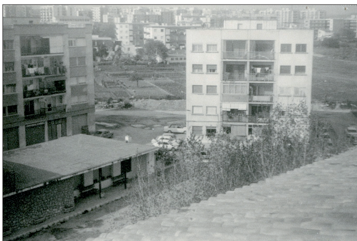
Carrers sense asfaltar. Torreforta anys 70.