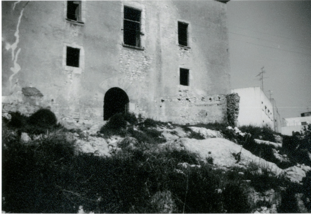
La Torre Forta anys abans de la seva reconstrucció (AHT)