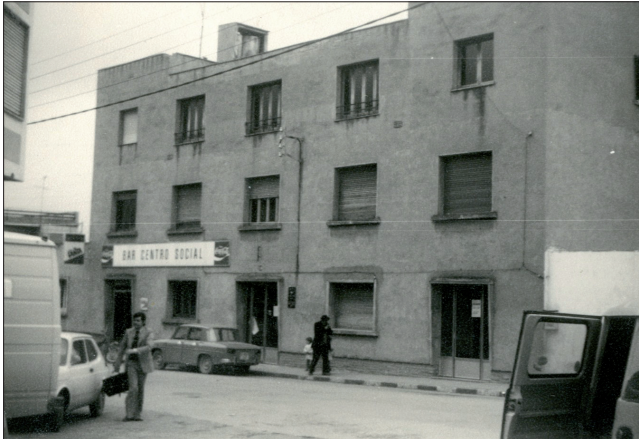
Centre Social, anys 70.

El magisteri de Joan XXIII i de Pau VI, així com el d'alguns bisbes, les associacions obreres catòliques i molts capellans de parròquia van donar consistència doctrinal i espiritual a aquest canvi i van establir un punt d'inflexió. Amb l'arribada al Pontificat de Pau VI, elegit papa el 21 de juny de 1963, va començar una llarga i complexa operació que va passar per una profunda renovació de l'episcopat per aconseguir que, fidel a la seva tradició, l'Església pogués desvincular-se lentament d'un passat històric que li impedia actuar en consonància amb els temps i encarar-se a un futur ple d'incògnites. Aquesta renovació de l'episcopat espanyol formava part d'un pla estratègic ben estudiat i executat pels més immediats col·laboradors del papa Pau VI, monsenyor Benelli i els nuncis Riberi i Dadaglio, així com alguns bisbes que des d'Espanya van secundar la iniciativa papal, l'arquebisbe Casimiro Morcillo i, sobretot, el cardenal Tarancón, entre altres.