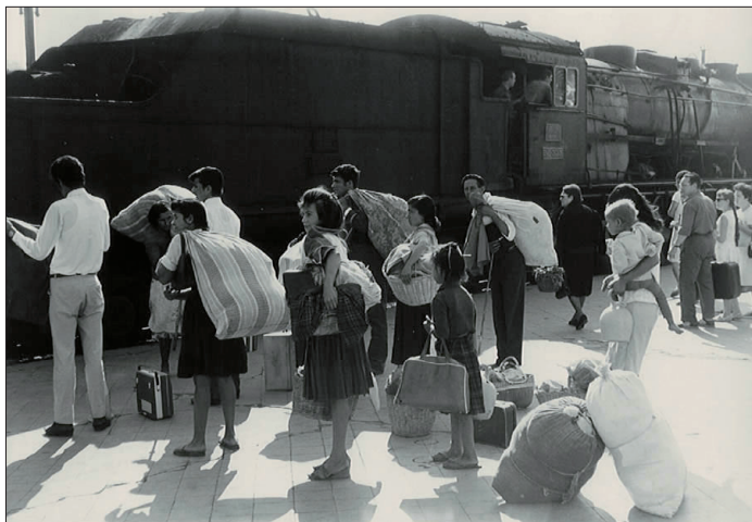
Dones i nenes migrant anys 60, Estació de Mora la Nova.