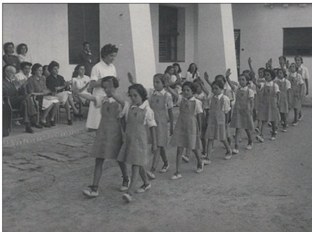
Nenes desfilant durant un acte de Sección Femenina. Autor desconegut. Archivo General de la Administración.

Aquesta situació va canviar a partir dels anys seixanta, quan van aparèixer els primers moviments feministes i la societat va començar a evolucionar. Per una banda, l'obertura econòmica va influir en el fet que, poc a poc, la dona s'introduís de manera silenciosa en l'àmbit del treball remunerat, encara que en sectors encara molt feminitzats. Per altra banda, el turisme europeu, també causà impacte en les dones espanyoles, que van obrir els ulls a un món nou per a elles, van veure que les dones estrangeres gaudien d'unes llibertats i una independència que elles no tenien. Per primera vegada van conèixer una realitat que fins aleshores havia estat amagada. Aquests moviments, van provocar un nou procés, conegut com «el destape». Mort Franco, les dones lluitaren i reivindicaren de forma clara i taxativa les millores de la seva condició femenina. 66