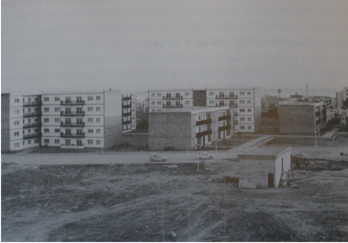
Els blocs de DUSA i IQA a Torreforta, 1968. Arxiu Fotogràfic de Dow Chemical

És en aquest context que la missió determinant de les dones serà la de productores i reproductores. Això explica que la seva funció social i educativa bàsica es trobés dirigida cap al matrimoni, la llar i la maternitat. Tant és així que progressivament observem un aïllament en l'espai privat, i l'adjudicació d'uns valors culturalment definits com femenins. L'home s'identificarà amb la raó i la dona amb el sentiment. Aquest capítol també analitza la incidència de l'Església catòlica, ja que va esdevenir un element clau dins de l'entramat educatiu franquista, a banda d'aportar els elements religiosos a l'ensenyament. Proliferaran aleshores a la península les congregacions religioses que s'adjudicaran l'educació per separat, tant de nens com de nenes. La formació oferta a les nenes serà molt bàsica i sempre centrada en la moral i la religió. A elles les preparaven per al matrimoni, les tasques pròpies de la llar i de la família. Aquesta importància que va assolir l'Església catòlica també es veu reflectida al barri de Torreforta. Destaca també el fet que a Torreforta les dones van tenir l'oportunitat de iniciar estudis ja d'adultes, al Centre Cívic o, fins i tot, podem veure com entre elles s'ajudaven per tal d'assolir coneixements bàsics de lectoescriptura, per exemple.