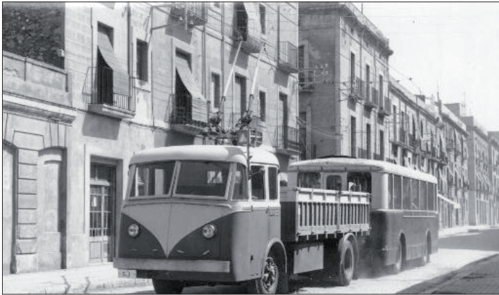
Trolebús Tarragona-Torreforta-Reus. Anys 60.

ques, o se les «animà» que abandonessin el seu lloc de treball: retirada del plus familiar als marits les dones dels quals treballessin, concessió d'un dot per matrimoni si al casar-se les dones deixaven l'ocupació laboral, o l'ampliació de la Ley de Contrato de Trabajo (còpia de la del 21.XI.1931) per la qual, a més d'haver de comptar amb l'autorització marital per desenvolupar una feina, hi havia la possibilitat que l'espòs es quedés el sou de la dona. La Orden del Ministerio de Trabajo del 27 de setembre de 1939 prohibia a «los funcionarios femeninos» obtenir la categoria de cap de l'Administració, i accedir als càrrecs de delegats i inspectors provincials de Treball. D'igual forma, es prohibia l'accés de les dones a notaries, al cos de registradors de la propietat, a la carrera diplomàtica i al secretariat de l'administració de justícia. Finalment, el Código de Comercio les inhabilitava per exercir activitats comercials, si bé amb el consentiment del marit podien realitzar-ne algunes. Una vegada materialitzada aquesta política de gènere, i molt especialment les mesures legislatives, la presència de les dones en l'esfera pública desapareix. 82