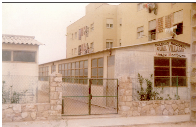
Escola Gual Villalbí, annex Montblanc, Torreforta. Autor desconegut. AHT.