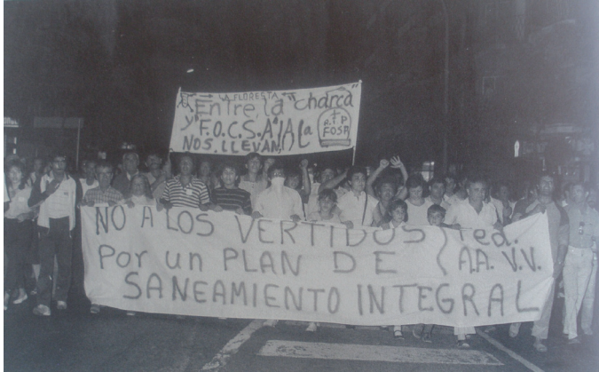
Manifestació Federació Associacions de Veïns 1985.

per diferents sindicats europeus. 68 Aquesta solidaritat es traduí en una manifestació amb gran afluència que va recórrer la Rambla Nova de Tarragona el 24 d'agost de 1974. Finalment, l'empresa va accedir a negociar i van acabar confeccionant el conveni propi. La victòria moral i organitzativa que va suposar aquesta vaga va reforçar els lligams ja estrets entre les treballadores de Valmeline i va forjar les bases per facilitar noves situacions de protesta.