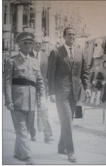
Franco inaugurant IQA al 1967.

postguerra. Les sancions que aquestes lleis preveien van ser duríssimes i podien ser, segons recollia l'article 8, de tres tipus: «restrictivas de la actividad», que implicava la inhabilitació absoluta per estudiar carreres universitàries i per a l'exercici de qualsevol professió, cosa que comportà un selectiu procés de depuració; «limitativas de la libertad de residencia», que implicava directament l'estranyament; la «relegación a nuestras posesiones africanas, el confinamiento o el destierro»; que significà l'exili o les migracions internes, i «económicas», amb la pèrdua total o parcial d'alguns béns determinats i/o de la feina, i amb el pagament de multes. 24