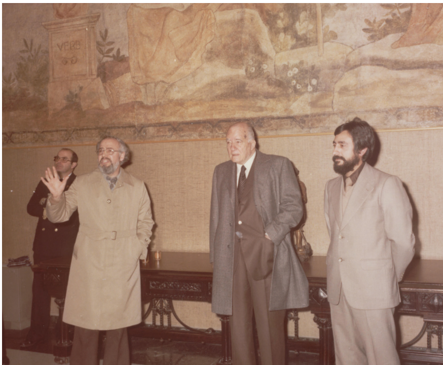
Recepció al Palau de la Generalitat del M. H. Josep Tarradellas a l'escola —mestres i alumnes— on estava treballant Antoni Gaudí (1979).