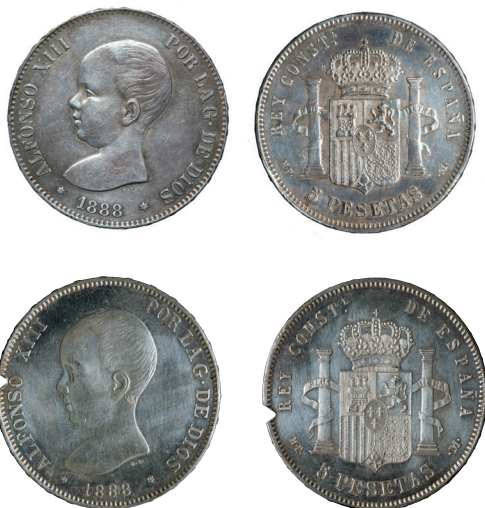
Alfons XIII, 5 pessetes de Madrid, 1888. La peça superior és una moneda oficial mentre que la inferior és falsa. Museu Nacional d'Art de Catalunya / Gabinet Numismàtic de Catalunya.

del terme de Mafet, vora d'Agramunt (Urgell), en el qual els mossos van localitzar en un camp la màquina i van requisar 37 arroves 57 de peces de sis quartos. Es van necessitar dos carros per fer el trasllat de tot el material requisat. Es van efectuar detencions i es van descobrir persones benestants del poble com a responsables de l'acció. 58 Aquests són només alguns exemples de la intervenció eficaç dels mossos en la repressió del delictes de falsificació com a resposta a l'acció del capità general que els va tenir com a eficients col·laboradors. A part, però, cal tenir en compte, com en altres episodis, la falsificació d'altres monedes nacionals o estrangeres.