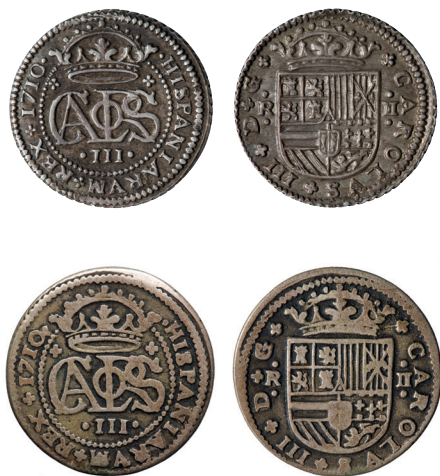
Arxiduc Carles d'Àustria, 2 rals o pesseta de Barcelona, 1710. La peça superior és una moneda oficial mentre que la inferior és falsa. Museu Nacional d'Art de Catalunya / Gabinet Numismàtic de Catalunya.

El pretendent austriacista a la corona espanyola, com és ben sabut, va ubicar la seva cort a la ciutat comtal entre el 1705 i el 1711 en l'interval que va de l'ocupació de la ciutat a la seva partida per ocupar el tron imperial a la mort del seu germà. A la Casa de la Moneda de Barcelona, no només hi va remarcar els arditès, o peces de dos diners, emesos en anteriors regnats, a més d'encunyar diners i rals de Barcelona, sinó que també hi va fabricar una gran quantitat de peces de dos rals o pessetes entre els anys 1707 i 1714. Aquestes últimes peces eren pròpies del sistema monetari castellà i, per això, no són usualment considerades monedes pròpiament catalanes per bé de ser-hi fabricades i que van circular per tot el territori dominat per l'arxiduc. La seva finalitat era tenir una peça menuda de plata —d'aquí el terme pessetes o peces petites— enfront de les peces grosses de vuit rals també anomenades pesos o pesos duros . Aquestes monedes havien de circular i ser acceptades arreu amb el pagament als soldats.