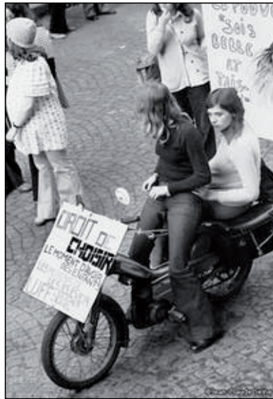
Eslògans feministes en una manifestació parisenca.

Francès. Del moviment estudiantil del 68, en va recollir les concepcions polítiques, la definició extensa de què és política, el radicalisme, la utopia i el messianisme, i a tot plegat li va donar continuïtat. «Tot és polític», es va dir durant el Maig del 68. És a dir, que la política no era un àmbit separat de la resta de la vida, ni la comesa exclusiva dels professionals de la política. Tot es podia posar en dubte: la política, les relacions socials...; però també la vida quotidiana, la cultura, la filosofia de la vida... L'objectiu era «canviar la vida». La democràcia només es concebia directa, immediata; se n'excloïa qualsevol idea de democràcia representativa. Aquesta concepció va ser també la del Moviment d'Alliberament de les Dones, que afirmava: «Allò que és personal també és polític.» Amb això volia dir que les relacions personals i privades 24 —domèstiques; però també afectives i sexuals— són, alhora, relacions socials. Són polítiques en la mesura que són col·lectives, fins i tot si es produeixen, ben sovint, en relacions interindividuais. En aquest sentit, no hi poden haver solucions individuals.