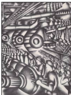
Jolan Gross-Bettelheim: Home Front , 1943

necessitat. 1918: les mestresses de la classe treballadora de Barcelona van convèncer les obreres tèxtils que fessin una vaga pels alts preus.