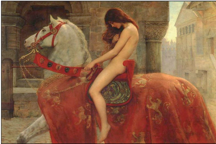
Lady Godiva, per John Collier, c. 1897 18

I tants d'altres que la saviesa de la gent ha anat conservant i repetint de generació en generació.